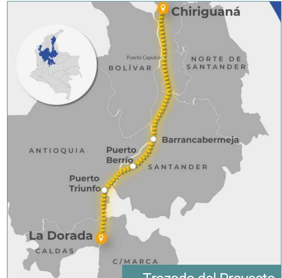
Trazado del Proyecto