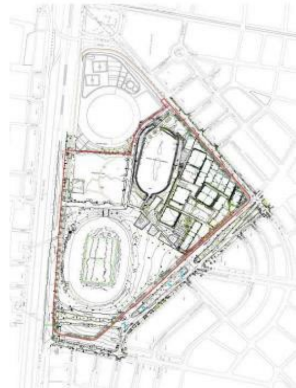
Polígono a concesionar

Contrato de Concesión bajo el esquema de Asociación Público Privada de Iniciativa Privada sin Recursos Públicos, tal como se regula en la Ley 80 de 1993 y en la Ley 1508 de 2012.